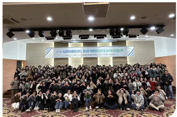
〈노인맞춤돌봄사업 생활지원사 워크숍〉