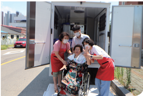
〈찾아가는 이동 목욕서비스〉