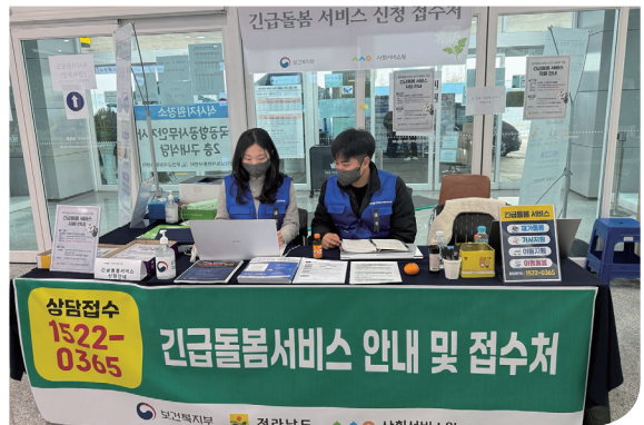
〈제주항공 여객기 참사 긴급돌봄 서비스 안내〉