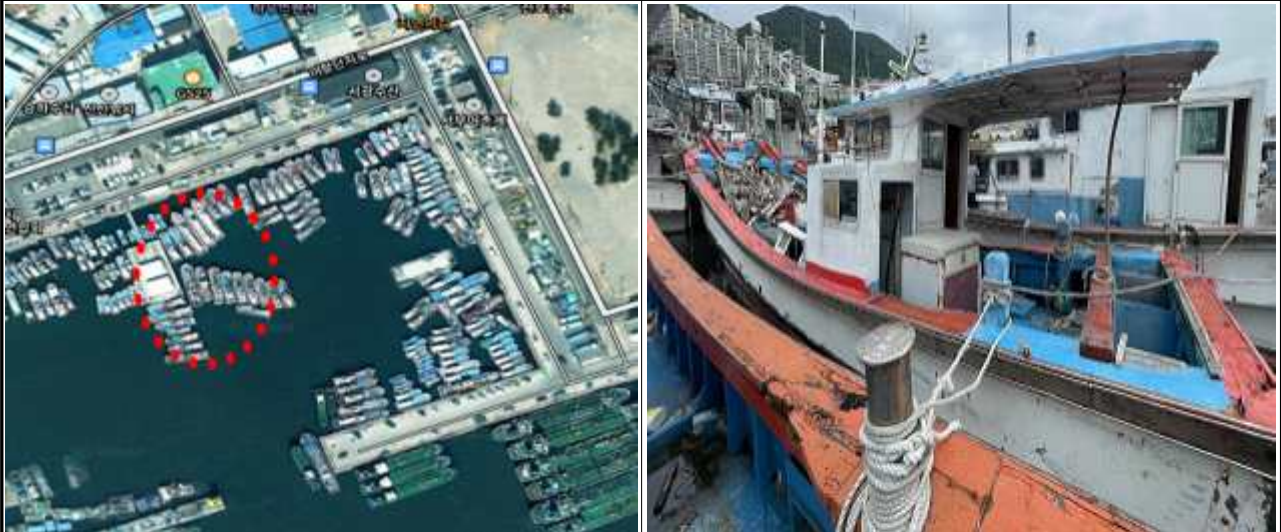
위치도 및 현장사진

위 방치선박은 어항의 효율적 이용을 저해하고 있으나 소유자가 불분명하여 「어촌·어항법」 제46조 및 같은 법 시행령 제41조항에 따라 위와 같이 직권으로 제거하고자 하오니, 이의가 있거나 문의사항이 있으신 분은 2025년 6월 18일까지 여수시 섬발전지원과(061-659-3991)로 연락하여 주시기 바랍니다.