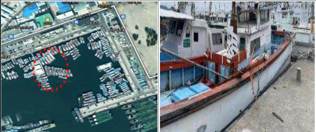
위치도 및 현장사진

위 방치선박은 어항의 효율적 이용을 저해하고 있으나 소유자가 불분명하여 「어촌·어항법」 제46조 및 같은 법 시행령 제41조항에 따라 위와 같이 직권으로 제거하고자 하오니, 이의가 있거나 문의사항이 있으신 분은 2025년 6월 18일까지 여수시 섬발전지원과(061-659-3991)로 연락하여 주시기 바랍니다.