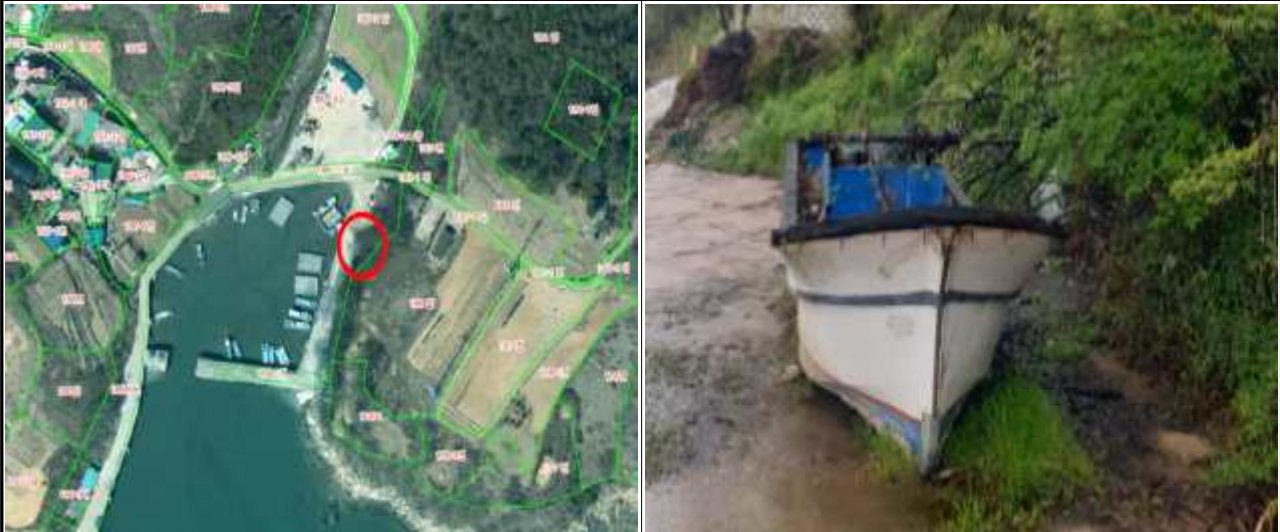
위치도 및 현장사진

위 방치선박은 어항의 효율적 이용을 저해하고 있으나 소유자가 불분명하여 「어촌·어항법」 제46조 및 같은 법 시행령 제41조항에 따라 위와 같이 직권으로 제거하고자 하오니, 이의가 있거나 문의사항이 있으신 분은 2025년 6월 18일까지 여수시 섬발전지원과(061-659-3991)로 연락하여 주시기 바랍니다.